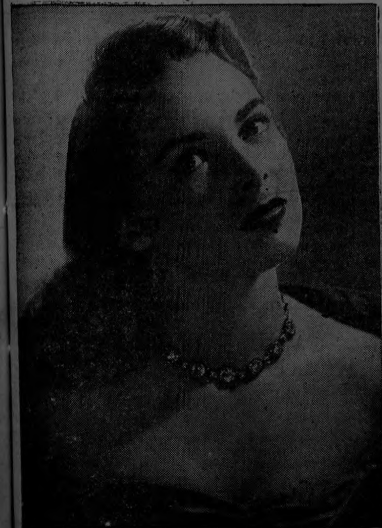
JANET LEIGH, estrella de la Metro Goldwyn Mayer

Janet Leigh, a quien corresponde por derecho el título de "Cenicicienta", fue contratada como actriz sin necesidad de pasar por las horcas caudinas de una prueba cinematográfica.