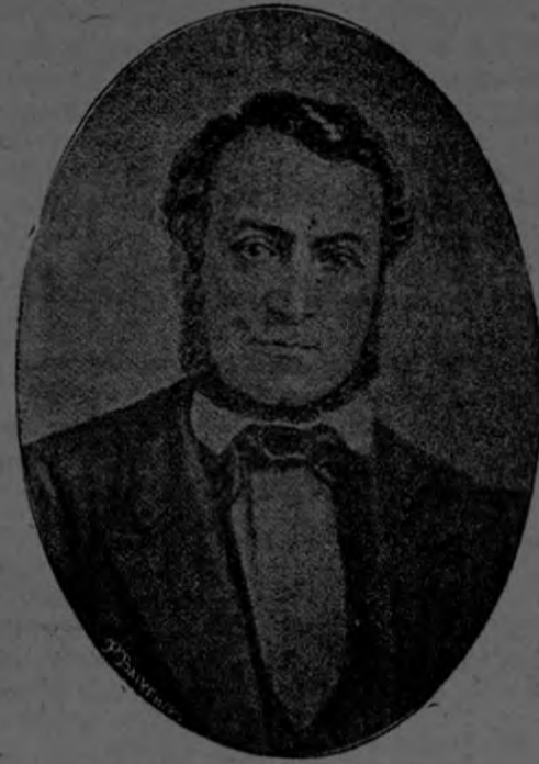
DON JUAN RAFAEL MORA

Hacemos referencia en datos biográficos de la personalidad de don Juan Rafael Mora, con motivo de cumplirse el sábado próximo el 90 Aniversario de su muerte. Nació este ilustre hijo de Costa