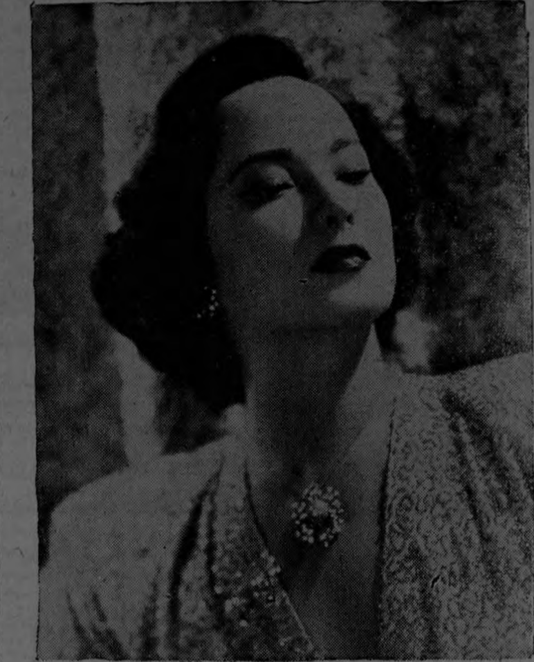
Una adorable personalidad, como la de la encantadora estrella MERLE OBERON, se refleja bien en el rostro de la mujer y aumenta su belleza física, hace notar el famoso experto de Hollywood, Max Factor Jr.

Lo que no es siempre cierto, ni mucho menos. Después de todo, aquella famosa y encantadora duquesa de hace varios siglos, Lucrecia Borgia, tenía sin la menor duda una definitiva personalidad... y con frecuencia la manifestaba envenenando a alguien... Así, no permita usted que cualquier clase de personalidad forme parte de su glamor.